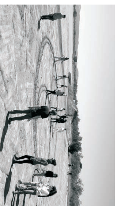
Col·lectiu BUIT Sobre el vídeo d'una intervenció a la caseta elctrica de la Pletera, 2016-2018. Vídeo documental, 13 min., 34 s.