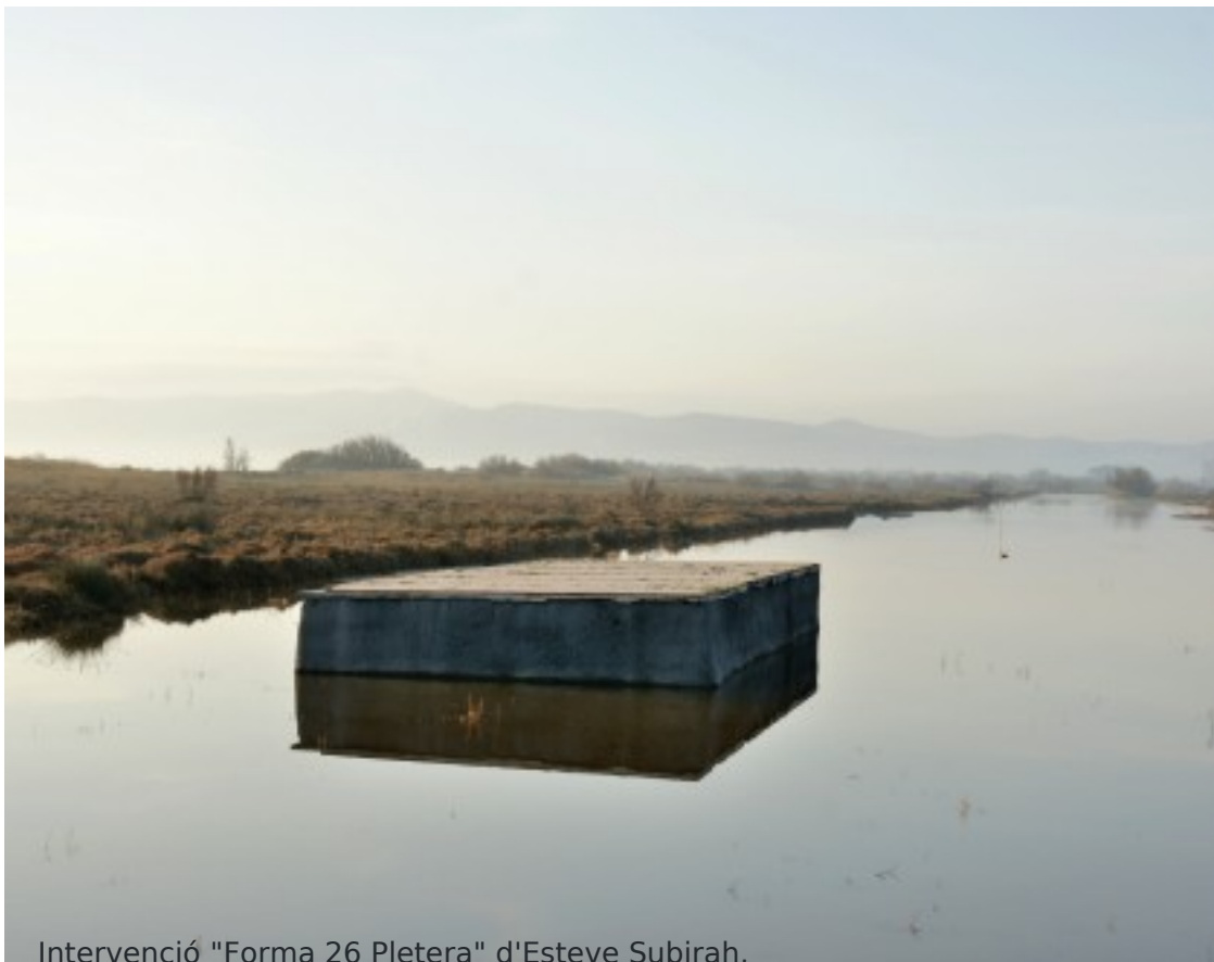
Intervenció "Forma 26 Pletera" d'Esteve Subirah.