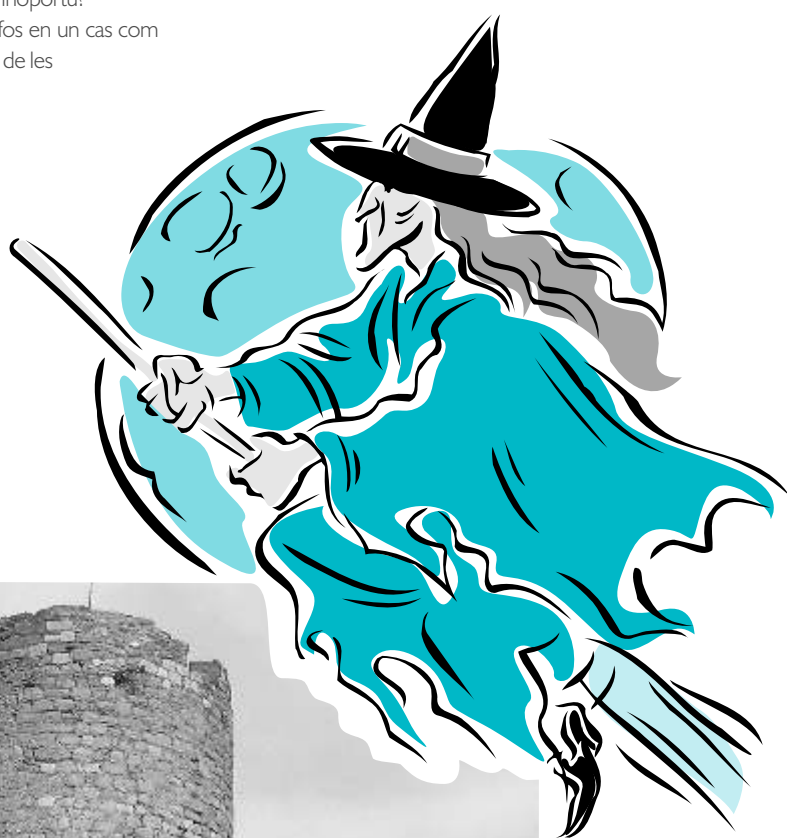
Fotografies de la torre de les Bruixes

Ara, evidentment, que cadascú triï la versió que més li agradi, encara que això no vulgui dir forçosament que sigui també la més correcta.