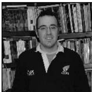
CA L'EVARISTU Llibreria

“Nosaltres hi som des del 1970, quan la mare va obrir el negoci, i la veritat és que nosaltres continuem venent, tot i que treballem més per a la gent d'aquí; cada vegada n'hi ha menys, de turistes, a favor de les segones residències. Els que venen de manera temporal, a l'Estartit, gastem realment poc”.