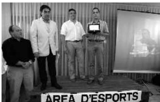
Equip Infantil Club Handbol Montgrí

Subcampió de Catalunya i campió provincial de la categoria aleví de bicicletes tot terreny, a més de fer podi en totes les curses que s'han realitzat fins a dia d'avui.