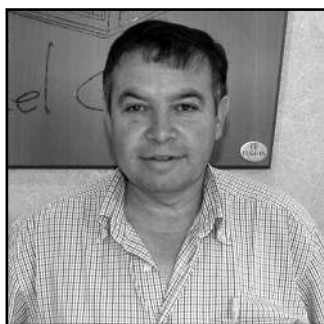
EL RACÓ DEL CAFÈ Cafeteria

“El comerç s'ha de contemplar des de dues vessants: per una banda, el comerç de temporada, a l'estiu, que va relativament bé, i per l'altra el comerç de tot l'any, que jo diria que està una mica estabilitzat. Torroella té molts compradors de la falda del Montgrí, i per això el tema del pont ens afectarà. Alguns ja ens ho han dit, i sé que això repercutirà negativament en la campanya de Nadal”.