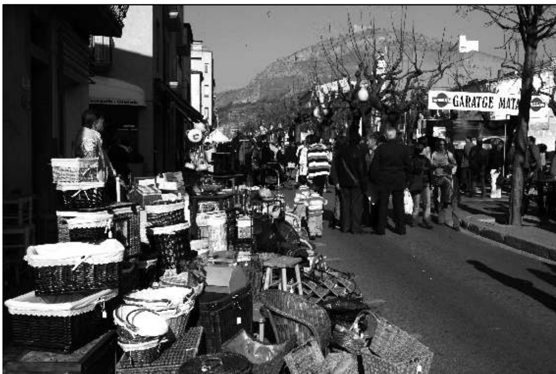
Imatge d'arxiu de la Fira de Sant Andreu

La reorientació i adaptació de la Fira als nous temps ha estat un dels reptes que han hagut d'afrontar els diferents sectors implicats. Malgrat les dificultats, però, el darrer cap de setmana de novembre continua essent un dels moments més significatius del calendari local, que aplega milers de visitants.