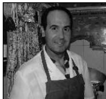
CAN PUJOL Carnisseria

“A Torroella hi ve a comprar molta gent de fora, dels voltants, però jo el que trobo és que els preus estan una mica descontrolats, que els comerciants arrodoneixen com volen, i la gent no sap si el que està pagant és el que realment val el que compra o no”.