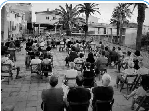
L'activitat cultural es va reprendre a partir del maig amb totes les mesures preventives.