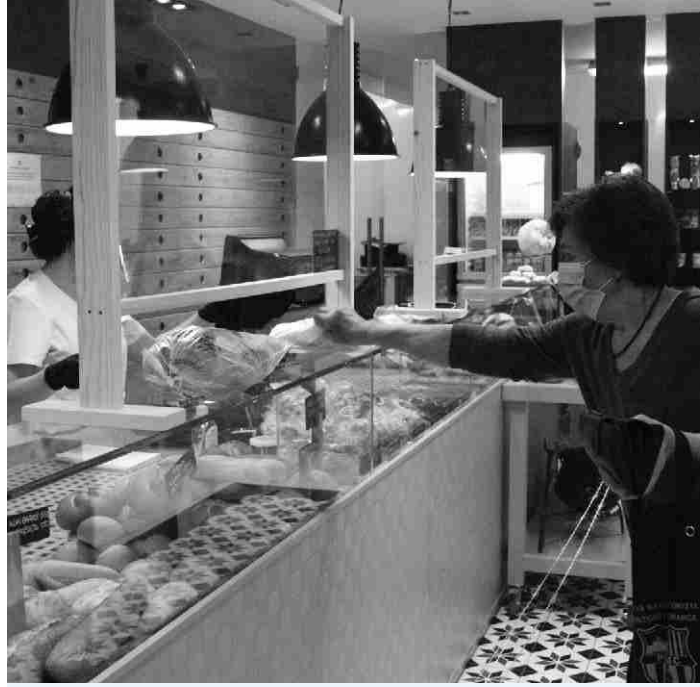
▲ Pagament a distància, a la Fleca Can Francès.

El sector comercial, sobretot el d'alimentació i de serveis essencials, va haver de canviar el seu sistema de treball i va crear noves maneres de proporcionar els productes. Seguint els protocols de seguretat, es va incrementar notablement l'entrega a domicili, i tots els professionals del sector van aconseguir que a la població no li faltés de res. Els següents testimonis ens parlen sobre com es va trastocar tot el funcionament.