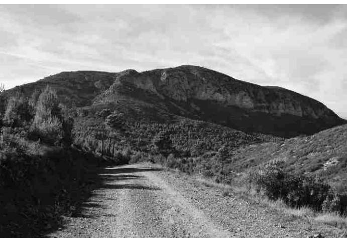
▲ Descendent per la pista de l'ermita, visualitzem la muntanya que hem carenat.

Preferible dur pantalons llargs, per evitar esgarrinxades. Calçat còmode i resistent, apropiat per a senderisme.