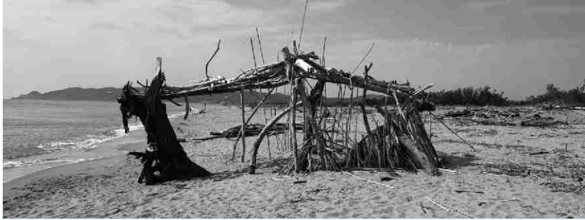
▲ Construcció efimera feta amb troncs i canyes aportats pel temporal.

El sobtat increment del cabal del Ter va afectar un dels punts de la mota, situa al pas Pilla, que s'estava reparant i encara era dèbil. Això va obligar a activar, a mig matí, un dispositiu d'emergència per reforçar-lo i evitar-ne el trencament, la qual cosa hauria ocasionat la inundació d'una bona part de la plana. Els operaris van treballar en un context realment advers. La majoria de carreteres del voltant estaven tallades i l'accés al pas Pilla no era gens fàcil. No obstant això, s'hi van poder abocar més de 2.000 tones de material que van estabilitzar la mota i tot va quedar en un ensurt.