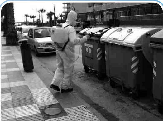
Desinfecció de carrers i serveis públics.