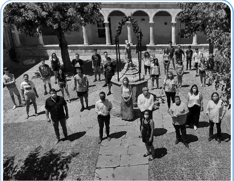
El vicepresident de la Generalitat, Pere Aragonès, va presentar a Torroella, el 25 de juny, la represa dels casals d'estiu a Catalunya.