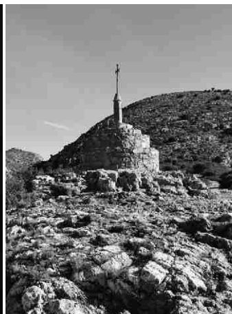
▲ El cau del Duc d'Ullà i la creu ens situaran a la meitat de la ruta.