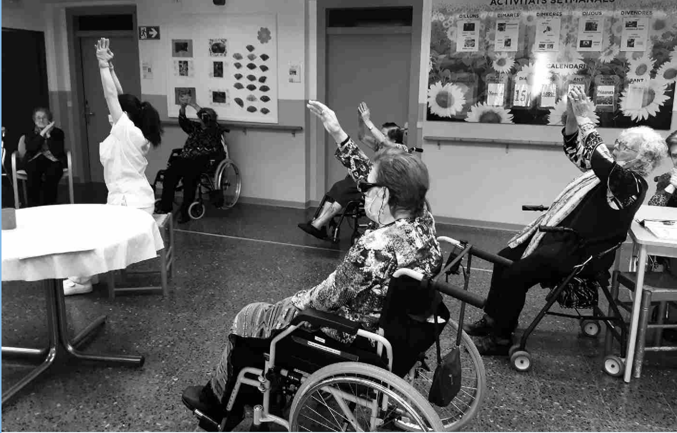
▲ Activitats a la Residència Santa Caterina, durant el confinament.