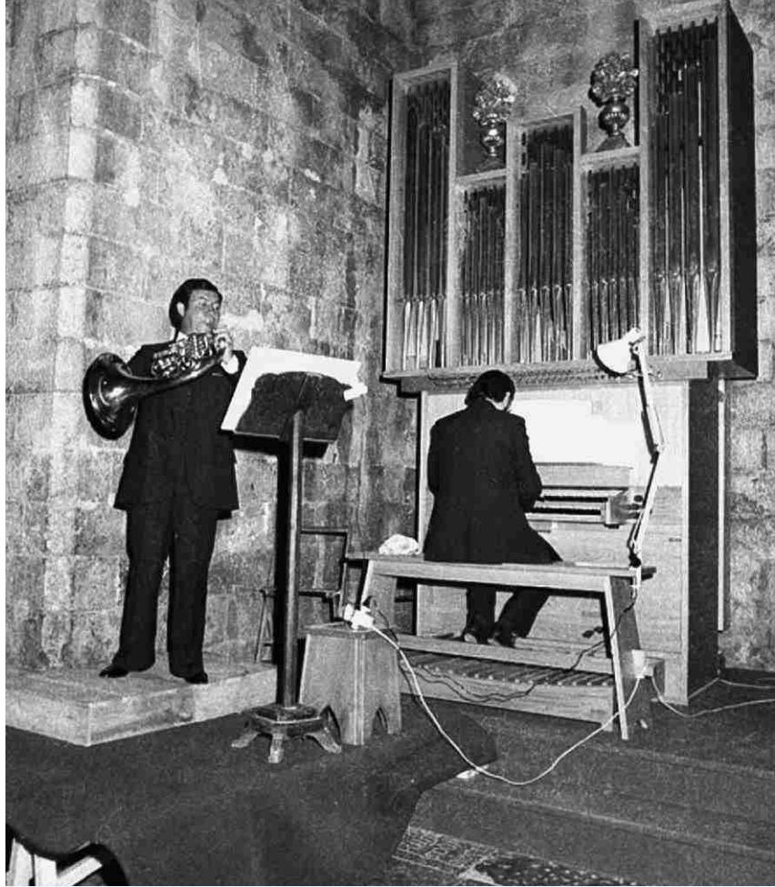
▲ Primer concert 1981

Tots els concerts es van fer a l'Espai Ter, llevat del concert inaugural de l'Orquestra Simfònica del Vallès, en què es va canviar l'auditori per l'esplanada exterior de l'Espai Ter.