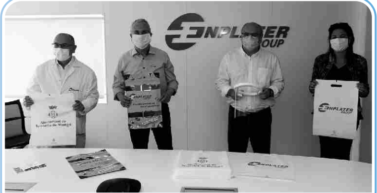
L'Ajuntament i Enplater van distribuir pantalles protectores entre el sector serveis.