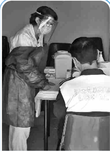
Cap agent de la Policia Local va donar positiu per COVID-19.