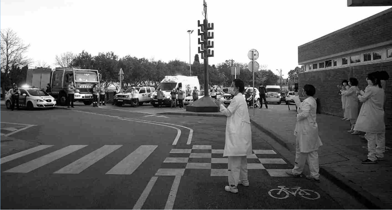
▲ Aplaudiments al personal sanitari i d'emergències.