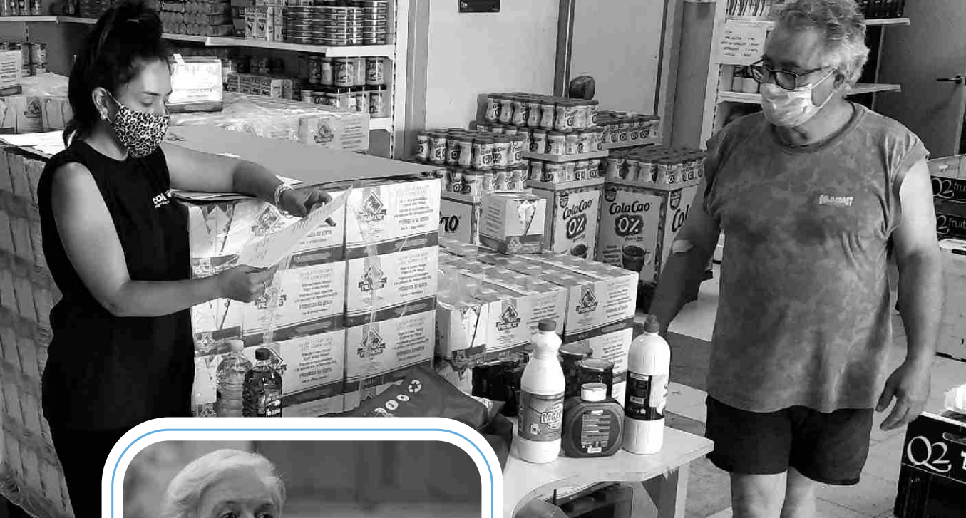
▲ Lliurament de mascaretes a l'Assemblea de Creu Roja a Torroella de Montgrí