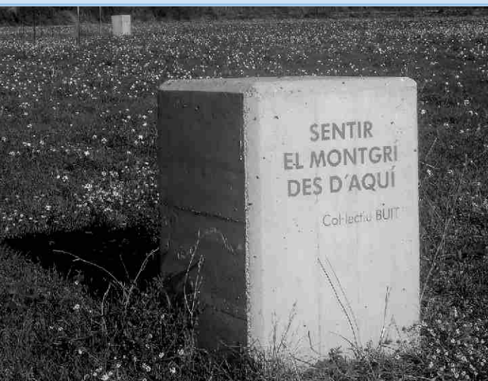
▼ Obra del Col·lectiu Buit que destaca la pau de contemplar el Montgrí