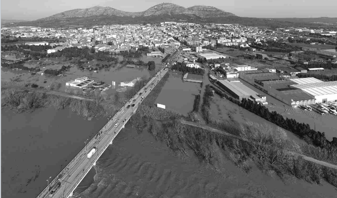
▲ El desbordament del rec del Molí va ocasionar la inundació de les hortes del Tamariuà, la potabilitzadora i una part de la plana agrícola.