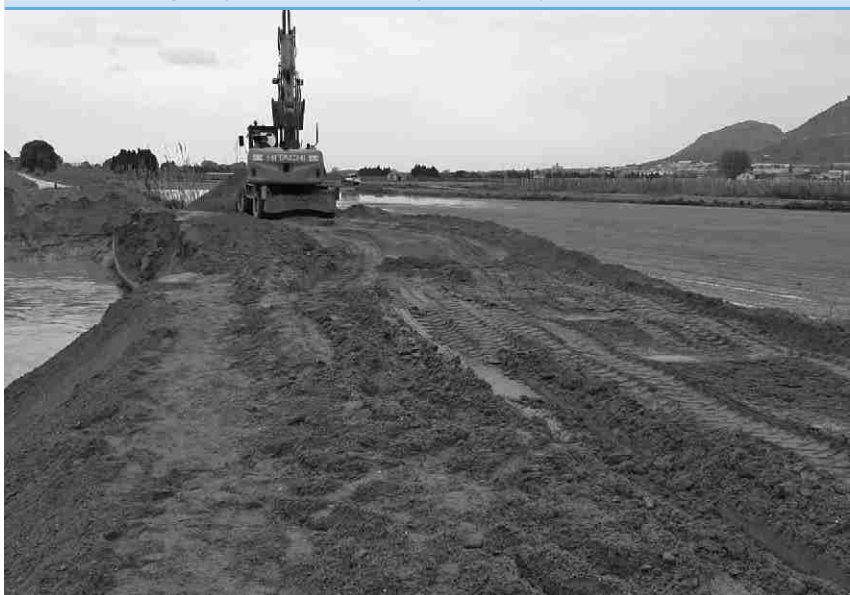
▼ Treballs d'emergència per consolidar la mota al pas Pilla.

Malgrat l'intens operatiu de neteja municipal, la gran quantitat de material acumulat i les contínues aportacions que va anar fent el mar durant molts mesos, va fer que a les platges naturals restessin durant l'estiu amb més troncs i fustes del que és habitual. Això va generar, de manera espontània, una de les imatges d'aquest estiu, que han estat la gran quantitat de construccions efímeres fetes amb aquests materials. Aquestes "casetes i cabanes" han donat molta projecció a la nostra destinació en mitjans de comunicació i xarxes socials, i han fet que moltes persones s'acostessin a les nostres platges.