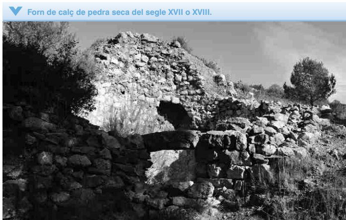
▼ Forn de calç de pedra seca del segle XVII o XVIII.