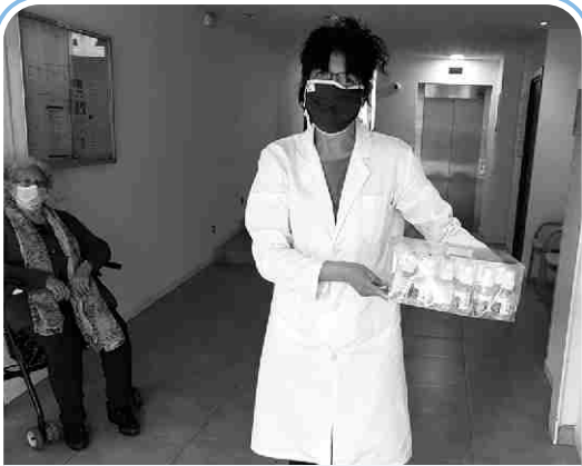
Particulars i empreses van cedir mascaretes i gel a serveis essencials i població vulnerable, quan no n'hi havia per a tothom.