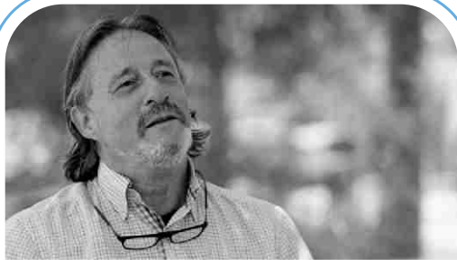
Martí Pi Transport públic

▲ Neteja i desinfecció de carrers.