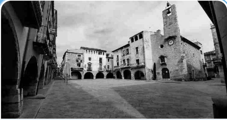
Una de les imatges del confinament: carrers i places sense vida.