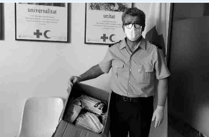
▼ Lliurament de mascaretes a l'Assemblea de Creu Roja a Torroella de Montgrí

«A mi, tot això m'ha fet sentir més persona; em sento més realitzada i molt plena podent ajudar-los i aconsellar-los. Personalment, m'ha donat molta vida.»