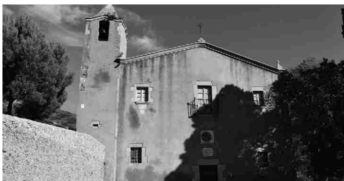
▲ L'ermita de Santa Caterina, en aquests moments, resta tancada als visitants.