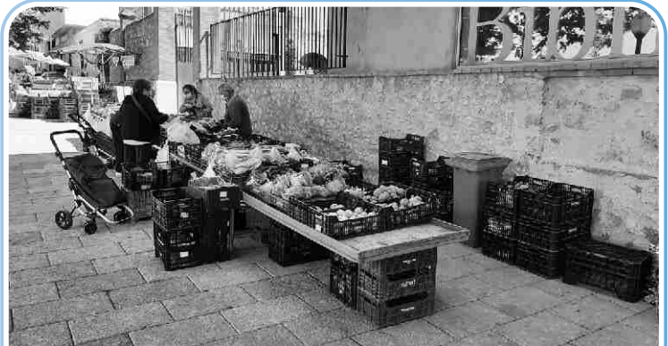
Les parades del mercat es van redistribuir per garantir la seguretat sanitària.