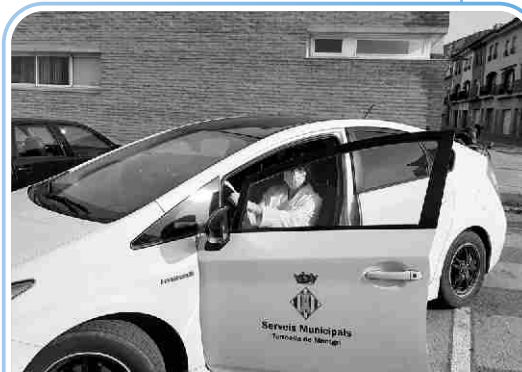
L'Ajuntament va cedir un vehicle municipal al CAP per poder fer atenció domiciliària.