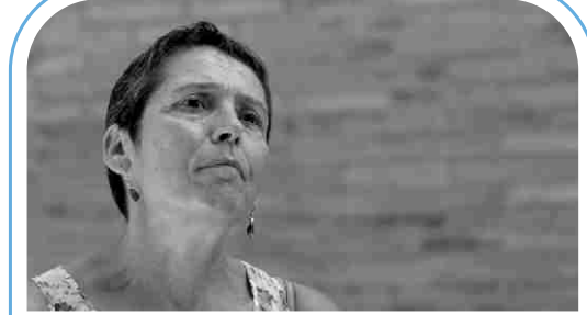
Magda Prats Informàtica

«A nosaltres ens ha contactat gent en quarantena i ens ha preguntat si hi havia possibilitat de comprar i rebre-ho a casa. I sí, nosaltres teníem unes normes de seguretat (vaig preguntar-ho i em vaig informar). Ho fèiem segons aquelles normes i a aquella gent se li va fer el servei, perquè, evidentment, no podien sortir a comprar; podia venir la família, però és clar, no pots estar empenyant sempre. No ho vam fer amb molta gent, però sí que hi havia qui ens va trucar i ens ho va dir clar: 'hem donat positiu, podeu venir a portar la compra?' I la gent gran que deia que no els deixaven sortir...; cap problema.»