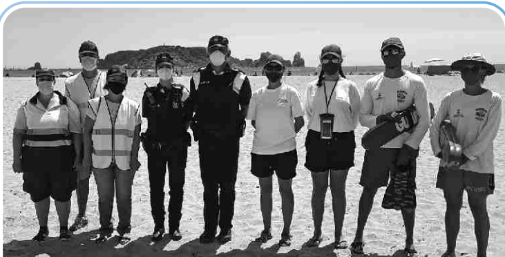
Durant l'estiu es va reforçar el servei de vigilància i agents cívics per ajudar a contenir la pandèmia.