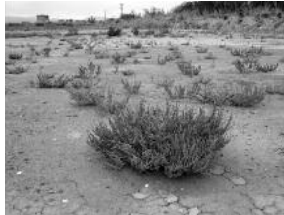
L'espai ja es troba en ple procés de colonització per la vegetació que li és pròpia, principalment salicòrnia, salsola, joncs i obione.

En aquests moments, els visitants de la Pletera poden veure fàcilment com avança el procés de revegetació i les diferències existents entre les 3 zones recuperades el 2015, 2016 i 2017. Els