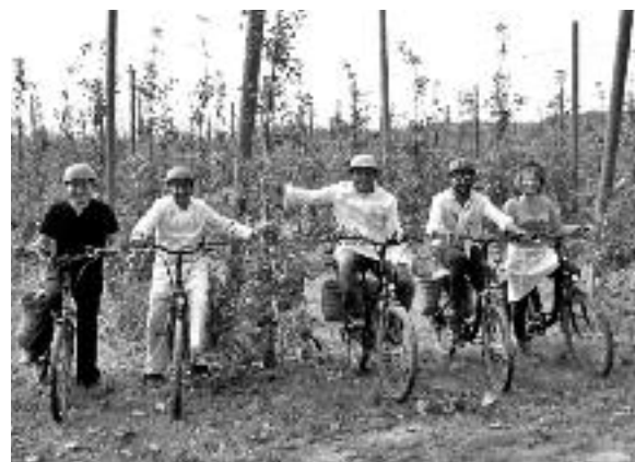
Les jornades es van presentar el 4 d'octubre a les instal·lacions de l'empresa d'activitats Ocitània, de Gualta, en un entorn privilegiat, envoltat de pomeres.

L'octubre es va celebrar una nova edició de les jornades gastronòmiques «La Poma a la Cuina», que enguany han comptat amb la participació dels restaurants Picasso (Torroella de Montgrí), Alba, Can Dalfó, Club Nàutic Estartit, La Palmera i Medes II (L'Estartit) i la programació de diverses activitats complementàries. Les jornades estan organitzades per l'Estació Nàutica Estartit-Illes Medes amb la col·laboració de l'Ajuntament, l'EMD de l'Estartit, l'IGP Poma de Girona i Vins i Caves Castell de Peralada.