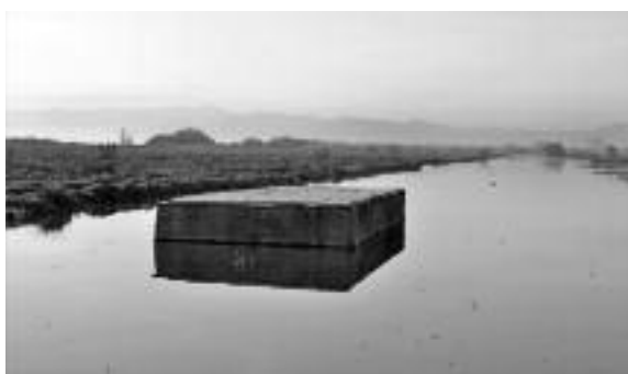
Intervenció "Forma 26 Pletera" d'Esteve Subirah.