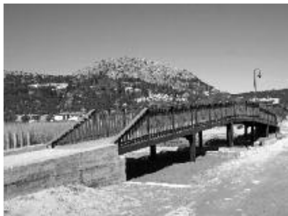
A l'esquerra, l'Oficina de Turisme de l'Estartit. A la dreta, el nou pont del Ter Vell.

Una dada que permet constatar la important aflluència de visitants ha estat les 35.575 consultes ateses a l'oficina de turisme de l'Estartit, un 9% més que l'anterior temporada. Pel que fa a l'ocupació, es consolida el creixement sostingut de les darreres temporades, una tendència que es mantenia, fins i tot, en els moments més compromesos de la crisi econòmica.