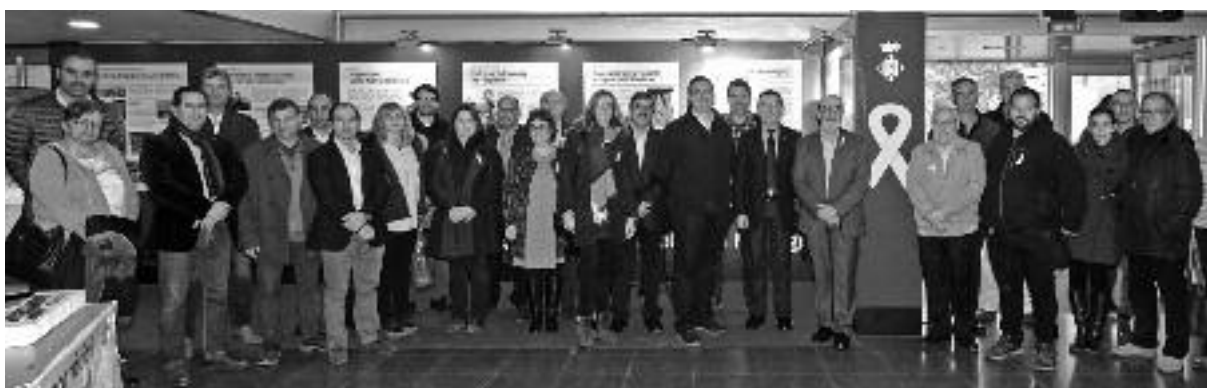
Imatge de la "no inauguració" reivindicativa de la Fira de Sant Andreu, a l'estand de l'Ajuntament, on s'hi va penjar un llaç groc.

L'1 d'octubre ens va fer amos del nostre destí, però venen dies en què haurem de reafirmar aquell compromís, fermament i pacíficament, com sempre hem fet. Una República d'homes i dones lliures bé que s'ho val.