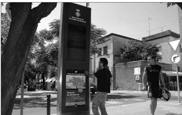
L'Smarpoint de Torroella s'ha instal·lat al passeig de Catalunya (esquerra), mentre que el de l'Estartit es troba a la plaça de l'Església (dreta)