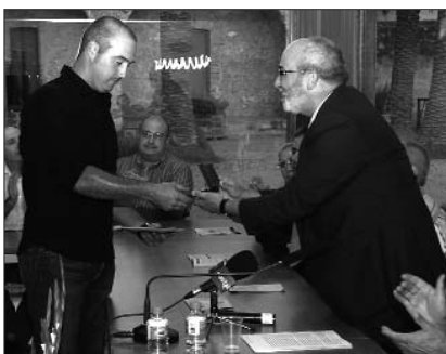
Club Handbol Montgrí