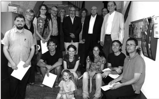
A l'esquerra, lliurament dels certificats de pas de cycle. A la dreta, imatge del concert inaugural a la plaça de la Vila.