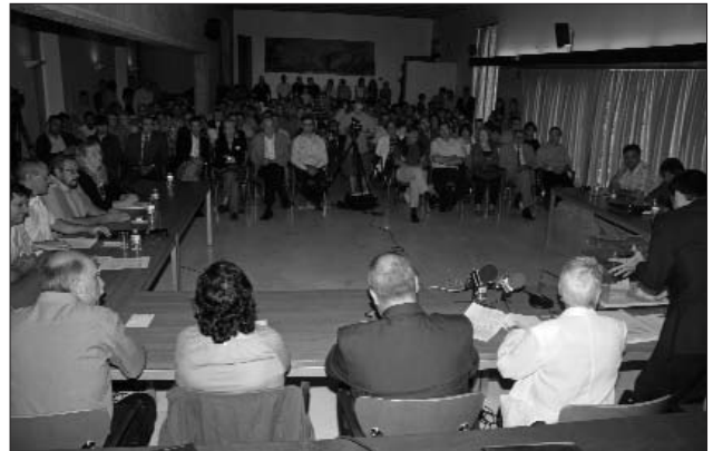
A l'esquerra, el nou alcalde, al centre, un cop va ser proclamat. A la dreta, aspecte general que presentava l'auditori de Can Quintana.

> Com preveu el reglament, la renúncia de l'exalcalde va obligar a convocar un Ple extraordinari de la corporació per tal de procedir a una nova votació. Per bé que aquest tràmit s'emmarcava en el compliment de l'acord de govern subscrit entre UPM i ERC, l'elecció es va realitzar amb la solemnitat que correspon a un moment tan important de la política municipal com correspon a la proclamació d'un nou alcalde.