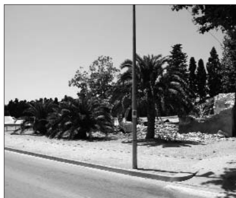
A l'esquerra, el dipòsit dels Griells, pocs dies abans de l'enderroc. Al centre, imatge de l'enderroc. A la dreta, el mas Radresa a terra.