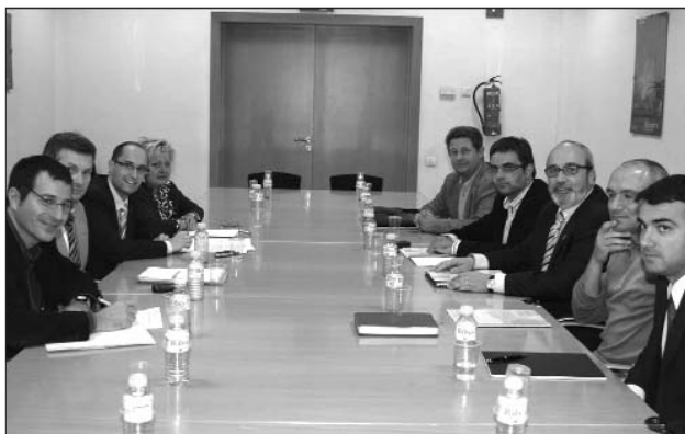
Imatge de les dues reunions de treball mantingudes amb la direcció general d'Administració local. A l'esquerra, a Barcelona (8-11-07) i a la dreta, a l'Estartit (14-3-08).