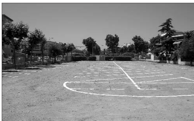
A dalt, l'espai de l'antiga biblioteca, que es condicionarà com a dependències municipals. A sota, el solar de l'Estartit que es vol destinar a la construcció de l'ambulatori i la nova llar d'infants.