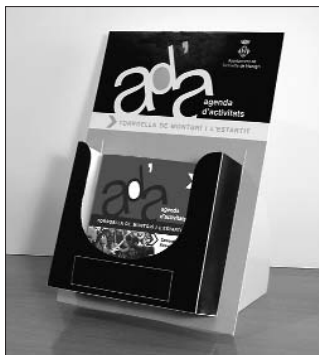
El primer número de la nova agenda va ser el del mes d'abril.

Aquesta nova publicació ha estat el resultat d'un important treball en el qual han intervingut diferents àrees municipals i té com a objectiu fer més propera i atractiva a l'usuari la informació sobre les activitats que es desenvolupen a Torroella i l'Estartit.