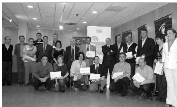
Foto dels responsables dels establiments certificats que van recollir el diploma acreditatiu al Consell Municipal de l'Estartit.