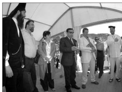
Un moment de la visita de la delegació sarda el maig passat durant la fira Mediterrània, Mar Obert.

Porto Torres encaixa perfectament en aquest perfil i la proposta ha estat molt ben acollida, fins al punt que l'Ajuntament de la localitat italiana ja ha aprovat iniciar els tràmits d'agermanar-se. La relació entre les dues poblacions es va iniciar el 2006 arran