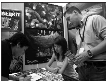
Imatge de l'stand del MIMA a la prestigiosa fira francesa de submarinisme d'Antibes.