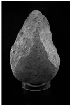
Pic del Montgrí

L'exposició també ens convida a plantejar-nos com ens relacionem avui amb el territori. Són capaços de combinar el progrés amb el respecte al medi? Ens hem fet finalment humans?