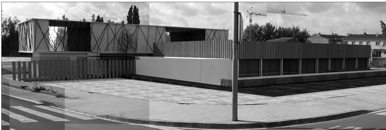
Projecció exterior de la façana nord del complexe esportiu i piscina municipal coberta.

Tot plegat, doncs, convertirà aquest equipament en un referent esportiu i social del nostre municipi i del Baix Ter.