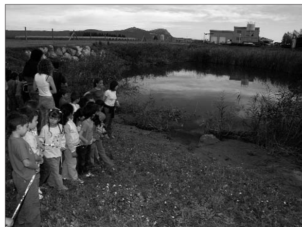
Els alumnes van tenir un paper actiu en l'alliberament. A la dreta, la bassa de cria que s'ha construït al costat de la depuradora.