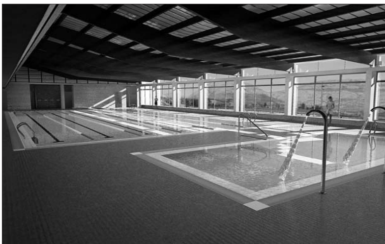
Vista interior de l'espai de piscines, des del qual es tindrà una bonica panoràmica del massís del Montgrí.

El complex esportiu vol relacionar-se amb la zona verda col·lindant, amb el Montgrí i el castell. Així, l'àrea de platja de piscina s'obre cap a aquests dos ele-