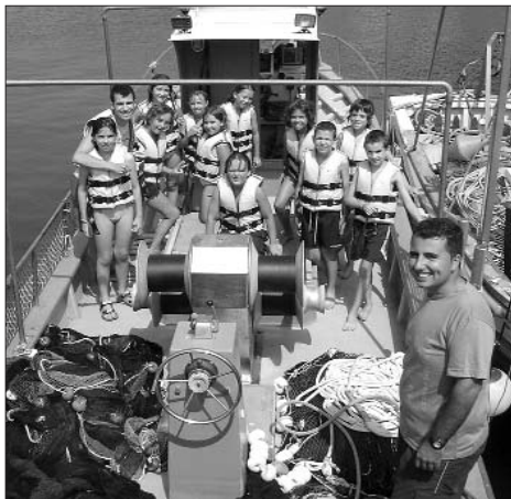
Els nens i nenes del Casal d'Estiu s'ho van passar d'allò més bé fent de veritables pescadors.

Es tracta d'una instal·lació que emet inal·làmbriament, és a dir, sense fils, i que permet als seus usuaris connectar-se a Internet amb ordinadors de sobretaula, portàtils, PDA's, etc. a un cost notablement inferior al d'altres operadors de telefonia. Estarà en funcionament des del 15 de setembre i de moment es cobrirà el 90 % del nucli urbà de Torroella i l'Estartit, i parcialment les urbanitzacions Torre Vella i Torre Gran. L'objectiu és anar ampliant les zones de cobertura, a mig termini. Podeu consultar les condicions de connexió a la web municipal www.torroella.org o a l'Ajuntament.