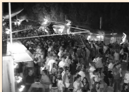
Nit a les barraques

Hem de destacar, a més, la reedició per segon any del Vermut popular, el diumenge a les 12,30 h a la plaça de la Vila, amenitzat amb danses populars a càrrec de l'Agrupació Sardanista Continuitat. Aquest mateix dia arriba el torn del teatre amb la reconeguda parella formada per Paco Morán i Joan Pera , que intentaran Matar al Presidente , amb el seu humor i la seva rauxa característica.