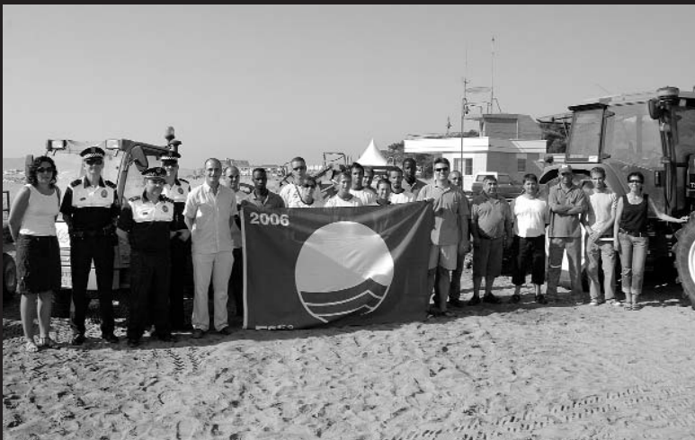
Autoritats, tècnics municipals, personal de Rescatadores i de l'empresa que fa el manteniment de la platja, amb la Bandera Blava.