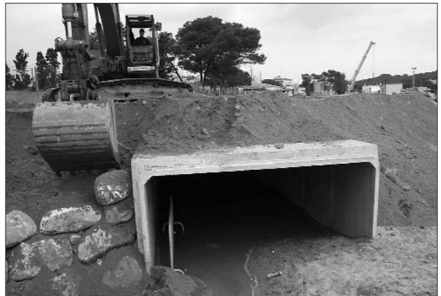
El nou traçat de la canalització de la riera evitarà que les aïngudes parteixin la platja en dos i que el llevant col·lapsi el desguàs, com passava fins ara..

En la mateixa línia d'estalvi, el projecte de millora de l'enllumenat públic que s'està portant a terme als nuclis de Torroella i l'Estartit també preveu mesures per reduir el consum i ser més eficients. Paral·lelament, a les instal·lacions municipals també s'han promogut mesures per minimitzar la despesa energètica i s'ha demanat als usuaris i treballadors que tinguin cura amb els usos.