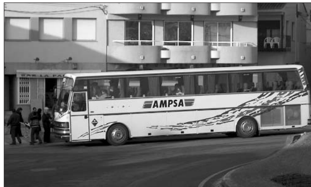
El nou servei es va posar en marxa l'1 de febrer.

Aquestes millores s'afegeixen a la posada en marxa ara fa un any d'una expedició d'anada i tornada a l'Hospital de Palamós, també reivindicada per l'equip de govern. Les peticions de millora en l'àmbit del transport públic es van formalitzar per acord de la Junta de Govern Local de 17 de gener de 2005. Amb posterioritat, l'Ajuntament va iniciar una campanya d'adhesió entre els municipis del Baix Ter, la majoria dels quals s'hi van afegir. També es reclamava una connexió amb l'aeroport de Girona, donada la component turística del municipi, que a l'estiu triplica la seva població.