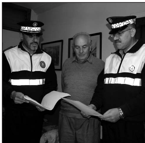
Els agents de la policia local van iniciar el mes de febrer les visites a domicili per donar a conèixer el servei.