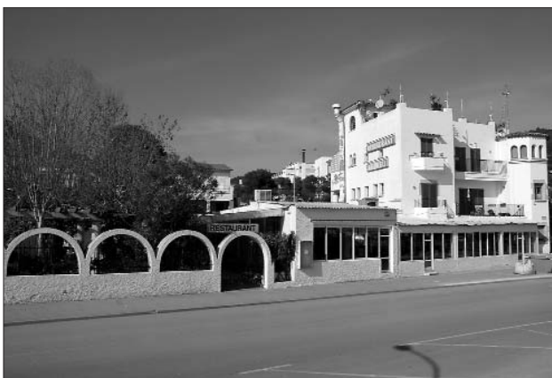
El Freu ja va ser catalogat fa tres anys com a equipament. Va ser construït els anys 60. Va ser fonda, restaurant i bar, però des de fa almenys cinc anys està totalment abandonat.