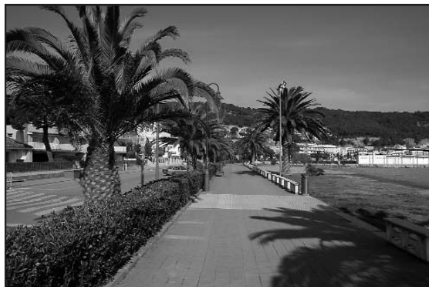
L'Estat té previst invertir prop de 3,5 milions d'euros en la remodelació del passeig marítim de l'Estartit. Per aquest any ja ha confirmat que n'invertirà 1.

En total s'hi han adherit 18 establiments. Malgrat que estem contents del resultat i hem considerat unes propostes de millora que s'han acordat amb el Consell Comarcal, aquest any 2006 volem ampliar l'àmbit de recollida. Volem comptar amb la implicació de més establiments per poder gestionar entre tots un dels residus amb un percentatge de reciclatge més elevat. Si hi esteu interessats, poseu-vos en contacte amb l'Àrea de Paisatge Urbà, al telèfon 972 75 25 33.