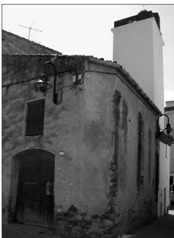
L'enderroc de la construcció annexa a la torre campanar millorarà la connexió entre els carrers Illes i Santa Anna.