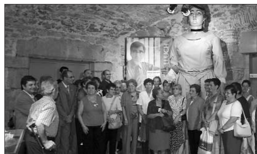
Les Puntaires del Montgrí van obsequiar la gegantessa de Torroella amb un mocador

> La greu situació de sequera que hem patit aquest estiu ha obligat l'alcalde a decretar en diverses ocasions la prohibició d'accedir al Montgrí en vehicle motoritzat. Les restriccions s'han portat a terme en coordinació amb el Departament de Medi Ambient i s'aplicaven quan el risc d'incendi arribava al grau 2 —molt alt— dels 3 que té el pla contra incendis de la Generalitat.