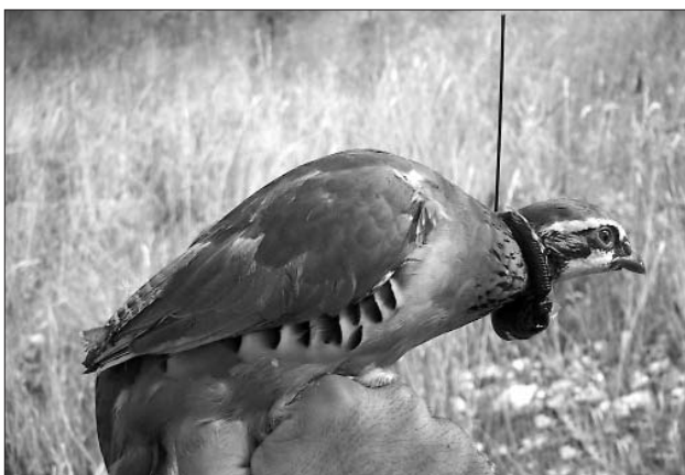
Els tècnics han col·locat emissors a una trentena d'exemplars alliberats per estudiar, mitjançant radioseguiment, l'efectivitat de les repoblacions.