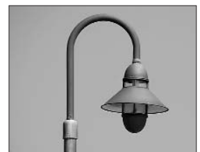
A dalt, model de punt de llum que es col·locarà al nucli antic de Torroella. A baix, els fanals de l'avinguda Grècia, que seran substituïts. i un dels models que es col·locaran a l'Estartit.

Paral·lelament al concurs de renovació de l'enllumenat, l'Ajuntament ha convocat un concurs per al manteniment de la xarxa d'enllumenat. La intenció de l'equip de govern és millorar la prestació del servei triplicant la dedicació que s'hi destinava actualment i aconseguint uns preus taxats que permetin disminuir les despeses en manteniment. En total s'ha pressupostat una inversió anual de 69.600 euros, més una reserva de 25.000 euros per a les intervencions complementàries necessàries fora del funcionament normal de la instal·lació per garantir la continuïtat del servei.