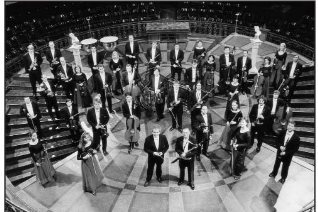
L'orquestra Filharmònica de Praga serà l'artista principal invitada.

Nascut com a festival de música clàssica —és membre de l'Associació Europea de Festivals des de l'any 1992— el Festival ha mantingut com a eix vertebrador de la seva programació l'anomenada música clàssica occidental, tot i que ha anat introduint elements extramusicals i mostres d'altres tipologies i cultures. Ha estat, doncs, una línia que destaca l'herència musical del país i de la resta d'Europa, però que inclou també la diversitat de pràctiques i experiències que la paraula música expressa en el món actual.