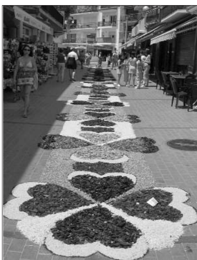
Una de les espectaculars catifes que es van poder veure al carrer Santa Anna de l'Estartit.