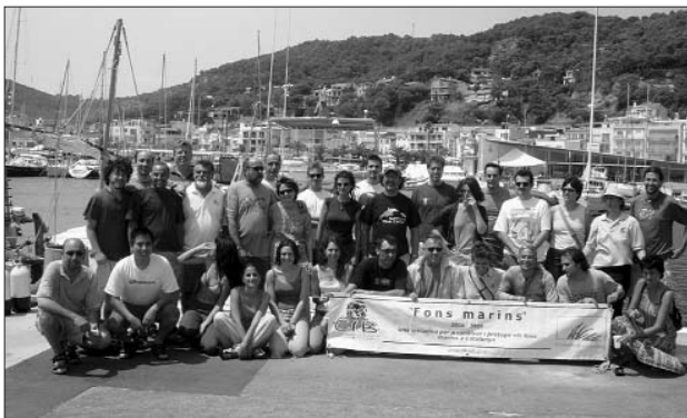
Alguns dels participants en la neteja del fons de posidònia.