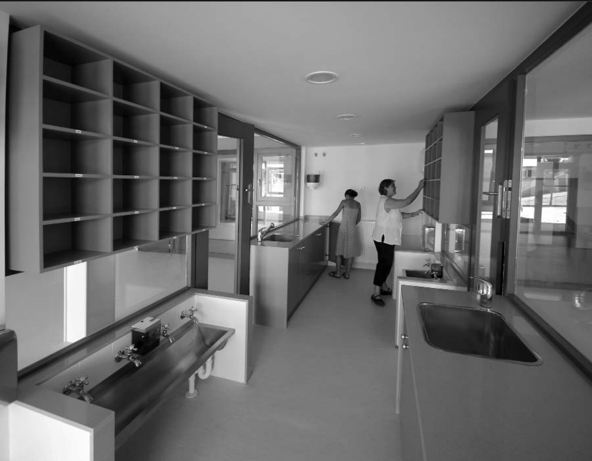
Imatge de la nova sala de canviadors que s'ha construït a la llar d'infants El Petit Montgrí.