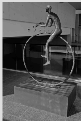
Xarxa i Bicicle, de Marta Moreu, es van instal·lar a l'Espai Ter a primers de desembre.

La Fundació Vila Casas ha cedit a l'Ajuntament dues escultures de l'artista Marta Moreu (Barcelona, 1961) perquè s'exposin a l'Auditori Teatre