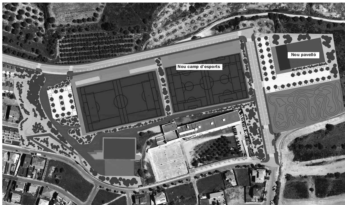
Imatge de la proposta de distribució final dels equipaments i vials que s'ha projectat a la zona esportiva municipal.

El 2016 iniciarem els treballs d'ampliació i remodelació de la zona esportiva municipal, amb l'objectiu de posar fi a les limitacions existents des de fa temps i planificar correctament les necessitats futures en l'àmbit esportiu.