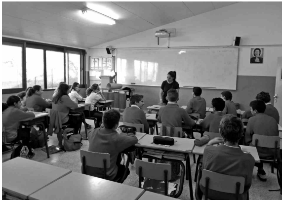
Alumnes del Col·legi Sant Gabriel durant una de les sessions formatives.

El CEIP Guillem de Montgrí, l'IES Montgrí i el Col·legi Sant Gabriel desplegaran aquest curs el programa «'Sigues tu', eines i actius per a la salut», destinat a fomentar els estils de vida saludables. És un projecte promogut per Dipsalut, que ha estat sol·licitat i concedit a l'Ajuntament, amb l'objectiu que es pugui aplicar als centres docents de la població.