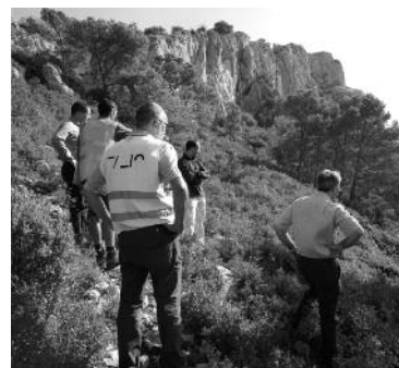
Els geòlegs han valorat els riscos potencials de desprendiments i han proposat les solucions.

Una part de les actuacions proposades per l'estudi geològic ja s'han executat i corresponen a l'àmbit de la urbanització Torre Moratxa, afectat per les esllavissades del novembre passat. En total s'han protegit 460 metres, amb 9 tramades de malles de diferents alçades i característiques, en funció de la càrrega que haurien de suportar. Les obres s'han portat a terme per la via d'urgència, han estat dirigides pel mateix ICGC i executades per l'empresa pública Tragsa. Han tingut un cost de 390.000 euros que cofinançaran la Generalitat, l'Ajuntament i els veïns.