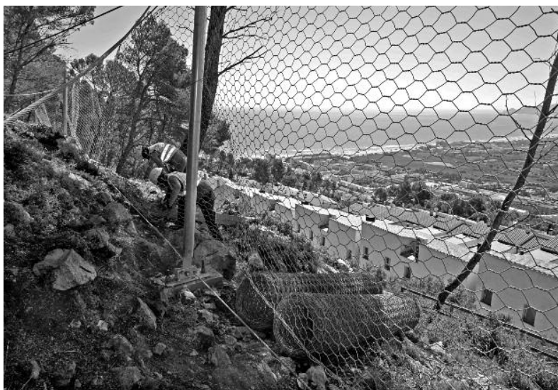
Un sistema de xarxes de retenció protegeix l'àmbit de Torre Moratxa on el mes de novembre dues pedres de grans dimensions van afectar dos habitatges.

L'Ajuntament disposa d'un estudi d'estabilitat de la muntanya al tram urbà de l'Estartit, en el qual s'analitzen els riscos i les solucions a adoptar per protegir els habitatges. L'avaluació es va encarregar a l'Institut Cartogràfic i Geològic de Catalunya (ICGC), que n'ha avualat tant la part pública com privada, en el tram comprès entre Torre Moratxa i el cap de la Barra.