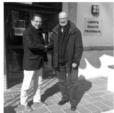
Els dos alcaldes, Cordon i Carles, a la sortida de la reunió.

actes que es desenvoluparan aquest any en el marc de l'agermanament que mantenim totes dues poblacions. L'agermanament es va iniciar l'any 1989 i, darrerament, els dos municipis hem obert un procés més intens per donar un nou impuls a l'agermanament. El carismàtic batlle de Torrelles ja ha anunciat que no optarà a la reelecció, però mantindrà el seu lligam estret amb la nostra vila i amb l'agermanament.