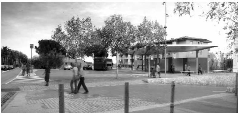
Projecció virtual de com quedarà el punt bus un cop acabat.

quatre andanes, parada de taxis i una marquesina per a l'espera dels viatgers. L'actuació comprèn una superfície total de 1.600 m 2 i inclou tota la urbanització perimetral, que donarà continuïtat al passeig. Permetrà concentrar les arribades i sortides dels serveis regulars i millorar la comoditat i seguretat dels usuaris. També oferirà una millor imatge, aspecte de gran importància per a una destinació turística com la nostra.