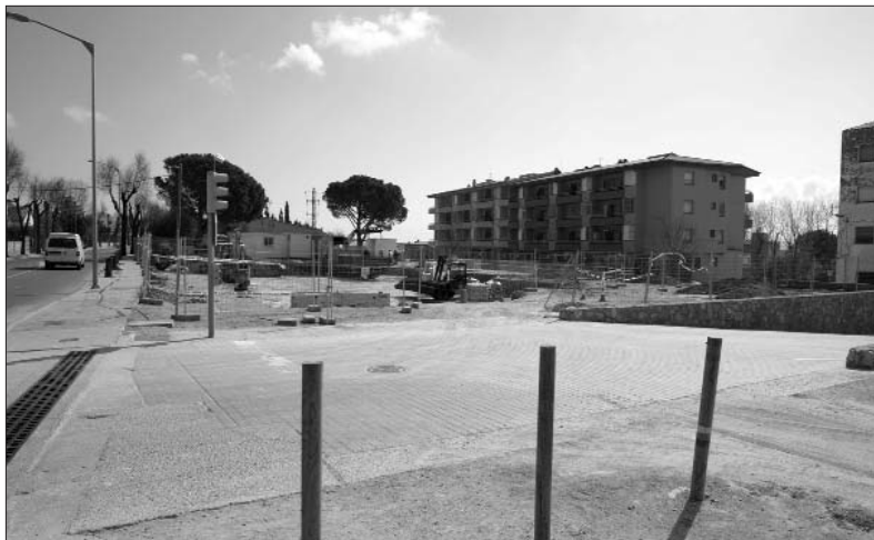
El reivindicat Punt Bus estarà situat al final del passeig Enric Morera.