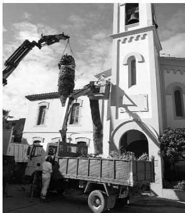
Dues imatges del complex operatiu de retirada de les palmeres.

Per bé que des de l'Ajuntament estem portant a terme totes les recomanacions dels experts, l'experiència fa concloure que a la llarga la pràctica totalitat de palmeres, tan públiques com privades, acabaran morint. Malgrat això, continuem aplicant els tractaments i fent tot el possible per salvar-les, ja que tot i no ser un arbre propi d'aquestes latituds, moltes s'han convertit en ele-