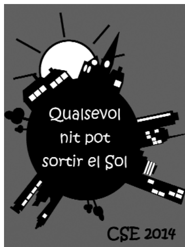
Cartell de la trobada d'enguany.

És una de les concentracions extraescolars més multitudinàries que se celebren als Països Catalans.