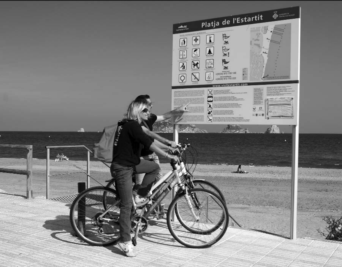
El cicloturisme és una activitat en creixement que ajuda a desestacionalitzar la temporada i ofereix un nou punt de vista del territori.