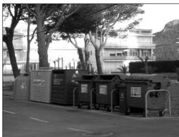
Punts de recollida de residus sòlids urbans al carrer Hortènsia, dels Griells, i al passeig Marítim de l'Estartit.

L'equip de govern preveu aconseguir un estalvi de prop de 100.000 euros portant els residus sòlids urbans (rebuig) directament a l'abocador de Solius, sense passar prèviament, com es feia fins ara, per la planta de transferència de Forallac. Per altra banda, s'està reorganitzant i reforçant la xarxa de contenidors per incrementar el reciclatge i la reducció del rebuig.