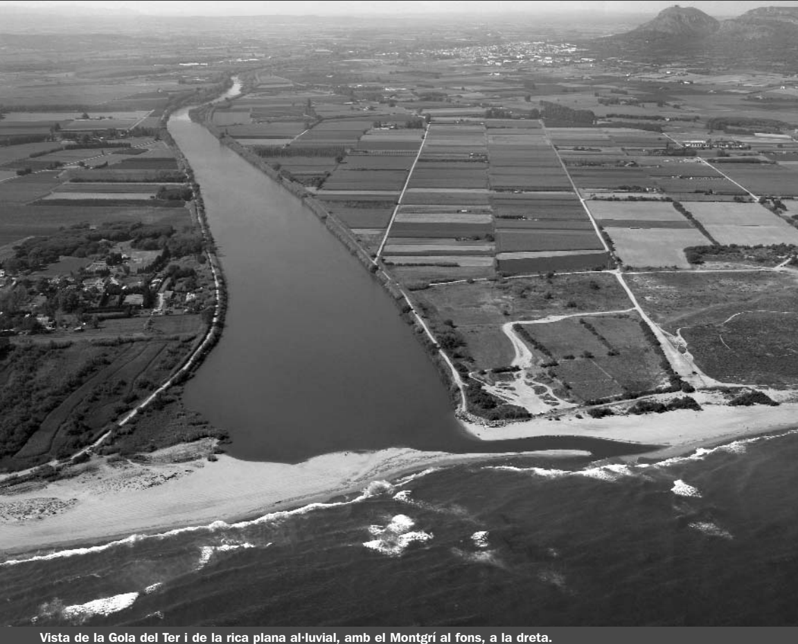
Vista de la Gola del Ter i de la rica plana al·luvial, amb el Montgrí al fons, a la dreta.