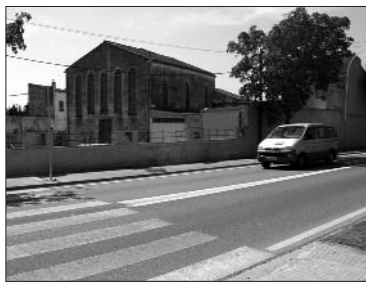
A l'esquerra, els nous aparcaments en bateria del carrer Figueres. A la dreta, l'antic escorxador, que s'enderrocarà aquesta tardor. El solar es condicionarà provisionalment com a aparcament.

L'Ajuntament està executant un pla de millora de la seguretat viària i la mobilitat per adaptar la situació del municipi a les directrius del Servei Català de Trànsit. En el marc d'aquesta actuació s'està millorant la senyalització, tan horitzontal com vertical, i s'està prioritzant que els carrers tinguin un sol sentit. Això permet disminuir el risc d'accidents i incrementar les places d'a-