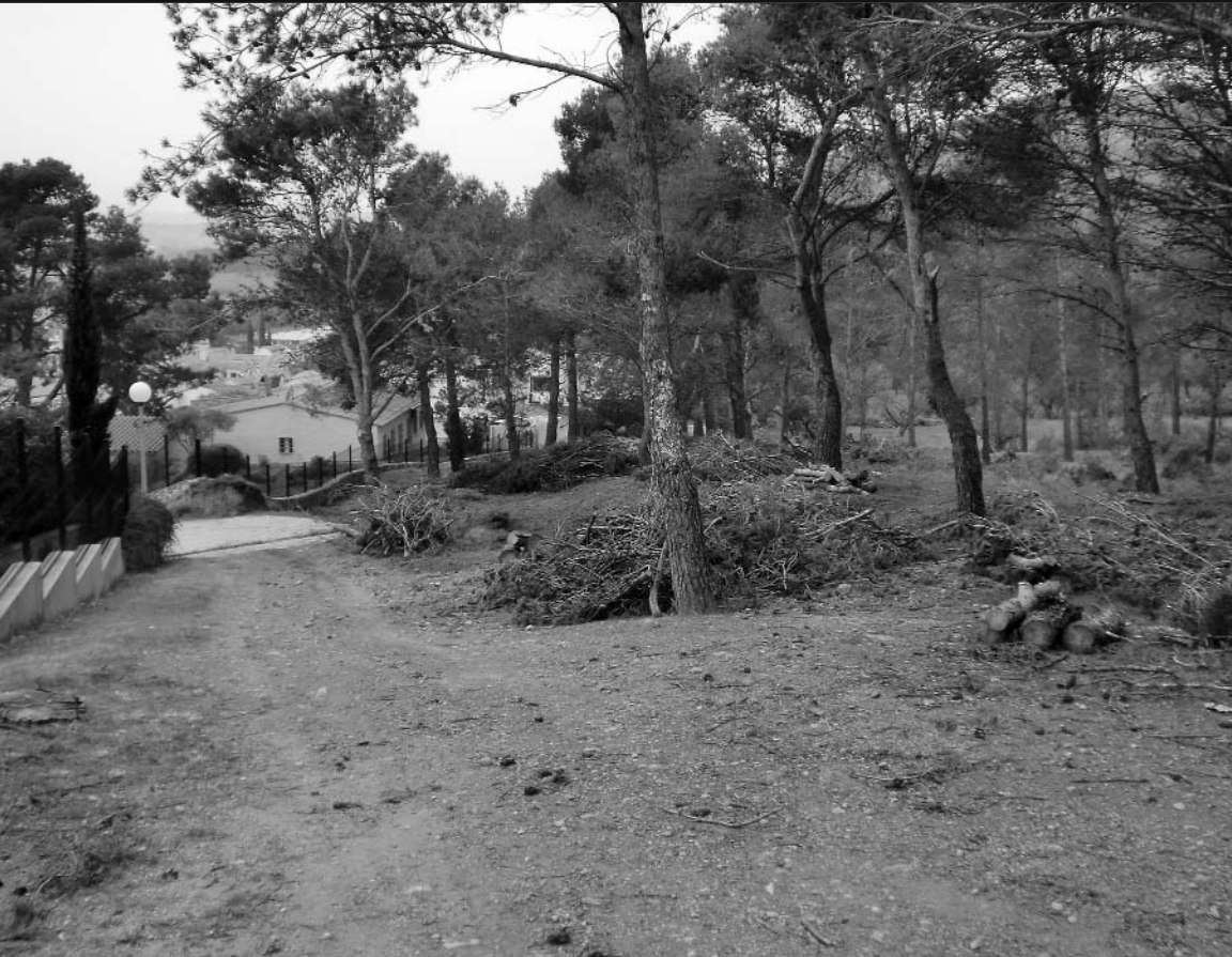
Detall d'una de les franges de prevenció d'incendis forestals que s'han fet a les urbanitzacions amb més risc.