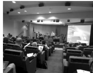
El 4 de juliol vam assistir a la presentació del projecte a la seu de la Direcció General d'Indústria i Empresa de la Comissió Europea, a Brussel·les.

L'European Tourism Indicators System for Sustainable Management at Destination Level, també coneguts com a ETIS, es basa en una llista de 27 indicadors obligatoris i 40 d'opcionals que intenten analitzar l'impacte de l'activitat en el territori a través d'aspectes com la gestió de la destinació o l'impacte econòmic, social, cultural i ambiental. Els ETIS són un procés per gestionar,