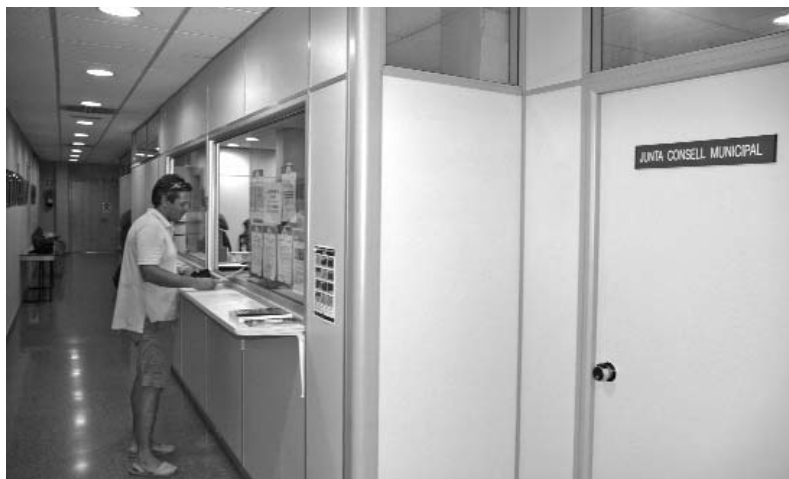
El Consell Municipal de l'Estartit funciona des del 2002 com a ens de desconcentració municipal. En breu serà la seu de l'EMD.

La Generalitat va aprovar, el 22 de juliol, la constitució de l'Entitat Municipal Descentralitzada (EMD) de l'Estartit. Es tancava, així, un llarg procés de tramitació iniciat el 2002, any en què es va posar en marxa el Consell Municipal de l'Estartit com una solució transitòria de desconcentració municipal.