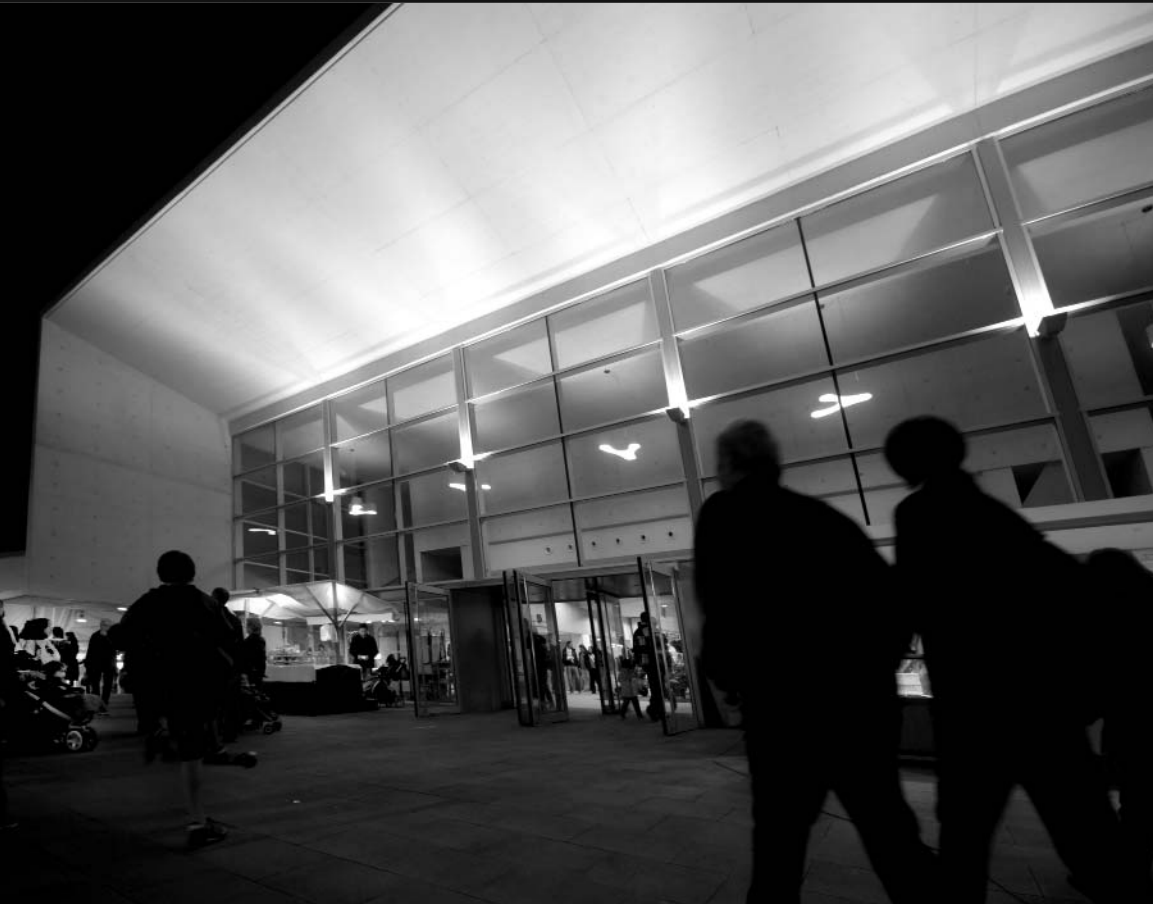
Visitants i expositors van fer una valoració molt positiva de l'Espai Ter com a recinte firal.