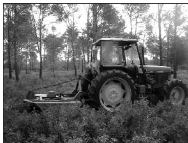
Les restes generades en les tasques de manteniment dels nostres boscos serviran per alimentar la caldera de biomassa del CEIP Guillem de Montgrí.

L'Ajuntament instal·larà el 2012 una central de biomassa per produir energia per a la calefacció dels tres edificis del CEIP Guillem de Montgrí. El sistema també produirà aigua calenta per a les dutxes del pavelló esportiu. Amb aquesta instal·lació es reduirà la despesa en electricitat i es donarà sortida a la massa forestal que es genera amb la gestió dels boscos del Montgrí.