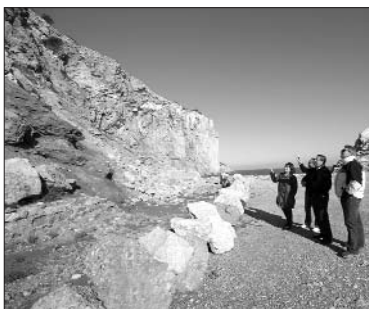
Les darreres llevantades han agreujat la inestabilitat de la muntanya i han reobert el forat de grans dimensions del passeig.

L'equip de govern considera que no es pot demorar més l'execució del projecte de consolidació del tram final del passeig del Molinet de l'Estartit i demana a la Generalitat i l'Estat que hi actuïn amb celeritat.