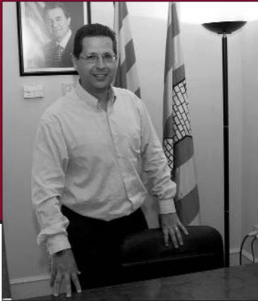
Jordi Cordon i Pulido Alcalde

«Aquest mandat serà clau per fixar les bases del nostre model de municipi. El moment és difícil, però no prendré decisions que siguin una càrrega per al futur. Aquesta no és la manera de fer. La crisi ens ha de servir per aprendre dels errors.»