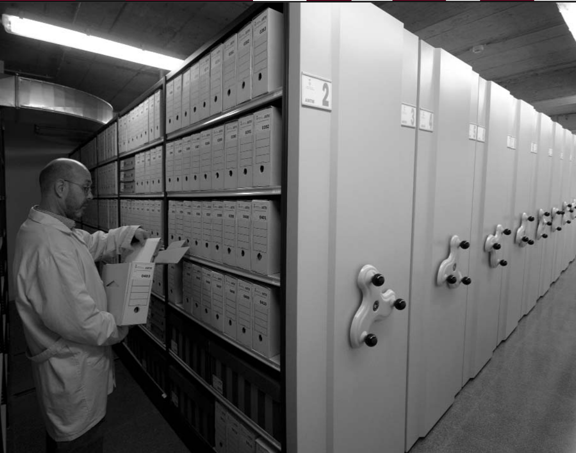
El nou equipament acull, entre d'altres serveis, l'Arxiu Municipal, on es custodia documentació històrica i administrativa.