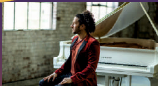
28.07.24–20 h Emmet Cohen Trio