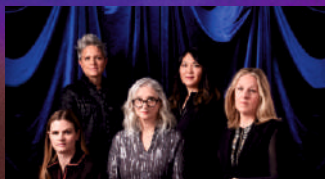
26.07.24–22 h Artemis