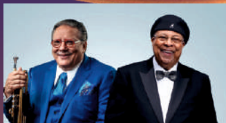
27.07–22h Chucho Valdés & Arturo Sandoval Reunion Band