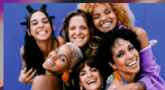
27.07.24–20 h Las Karamba